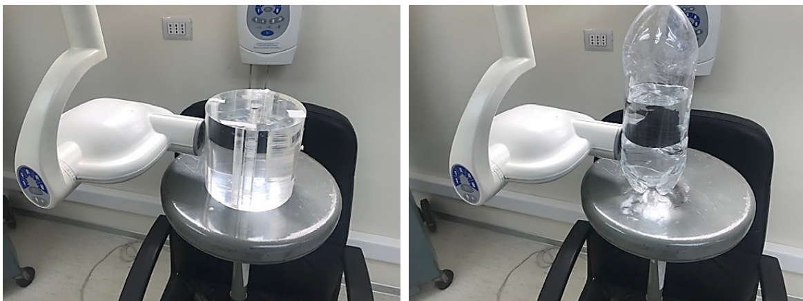
Imagen de la ubicación del dispositivo simulador de paciente.

7.3.2. Posicionar el localizador del equipo en contacto directo con el simulador y en dirección perpendicular al eje del mismo.